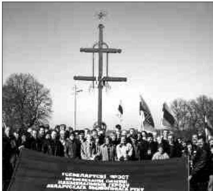
Удзельнікі Ёсебеларускага Фэсту, прысьвечанага памяці нацыянальных герояў Беларускага Вызвольнага Руху 1863-1864 гг.