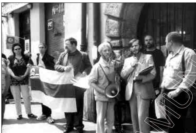
Кракаў. 3-га ліпеня 2000 г. Дэманстрацыя Камітэту „Польшча-Беларусь” перад кансулятам ЗША, супраць расейскай імперскай палітыкі ў Беларусі і Чачэніі. Патрабаваньні спыніць дапамогу Амерыкі для Расеі.

рэжыму беларуская культура ёсць першы вораг. Бо ў грунце справы — рэжым ваюе супраць беларускай нацыі.