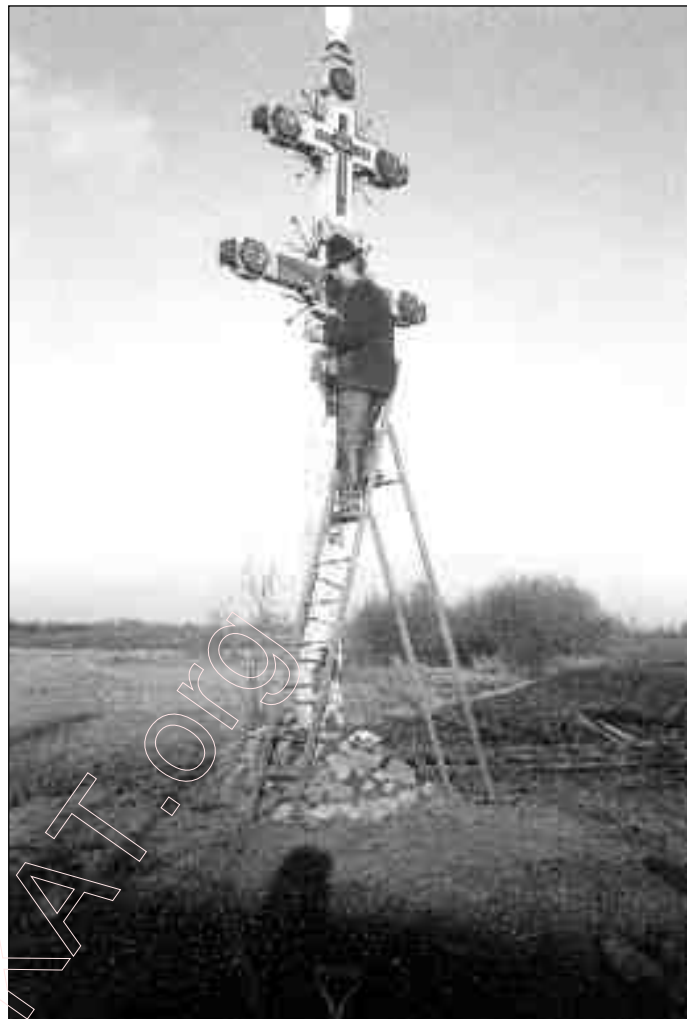
Крыж у Чэхах. Рабочы момант аздабленьня крыжа.

„У сэмінарыю я прыхаў на пачатку ліпеня. Адрозьніваю ў храм, дзе здзівіўся, убачыўшы ўніяцкія абразы. Увогуле, усе храмы там пабудаваны ўніяцкімі. Прайшоўся па манастыры. Са мной быў сэмінарыст зь Берасьця. Спытаў яго, як ён пачуваецца ў Жыровіцкім