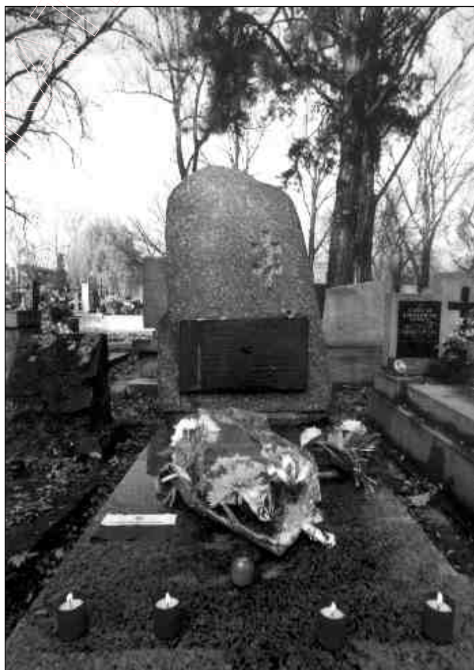
Магіла Алеся Гаруна на Ракавіцкіх могілках у Кракаве.

Ю.Сьвірко: „13.05. Я бачу каля 5 тысячаў удзельнікаў. Сьцягі..., беларускія песьні. Спакойна. Палкоўнік Саланец вядзе прыяцельскія