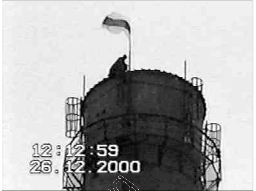
Мірон у вышыні. 26 сьнежня 2000 г.

Сутнасьць у тым, што ў Казахстане не было рэальнай палітычнай альтэрнатывы. Калі няма альтэрнатывы, то тым, хто галасаваў супраць дыктатара, няма да каго апэляваць, няма каго супрацьстаўляць, няма свайго выбару, няма прычыны і фігуры, каб кансалідаваць барацьбу і прад’явіць канструктыўныя прэтэнзіі фальсіфікатару.