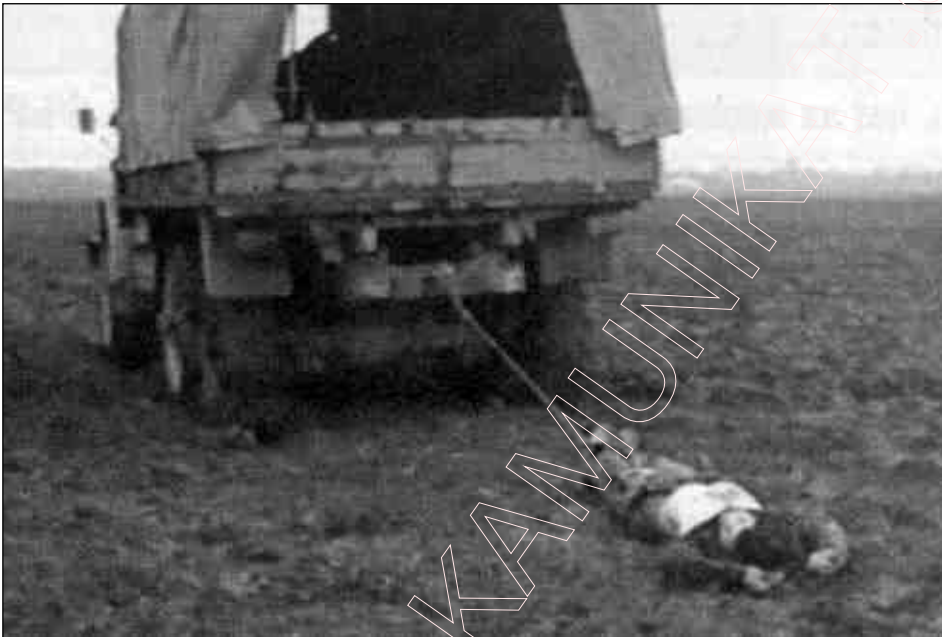
Расейскі ваенны грузавік цягае на полі забітага чачэнца.

Варта яшчэ ўспомніць „Дагавор аб міры і прынцыпах мірных