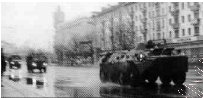
Лістанад 1996-га. На вуліцах Менска.

Мне казалі, што „стэйтмант” яшчэ не аддадзены ў друк (было паміж 9-й і 10-й раніцы). Я адклаў свой даклад убок і сказаў, што буду гаварыць пра начныя падзеі ў Менску, паколькі становішча зусім не такое, як адлюстравана яно ў паведамленьні Дзярждэпартаменту. Я растлумачыў прысутным, што на самай справе расейскае кіраўніцтва прыехала ратаваць свае каляніяльныя інтарэсы ў Беларусі і падтрымаць