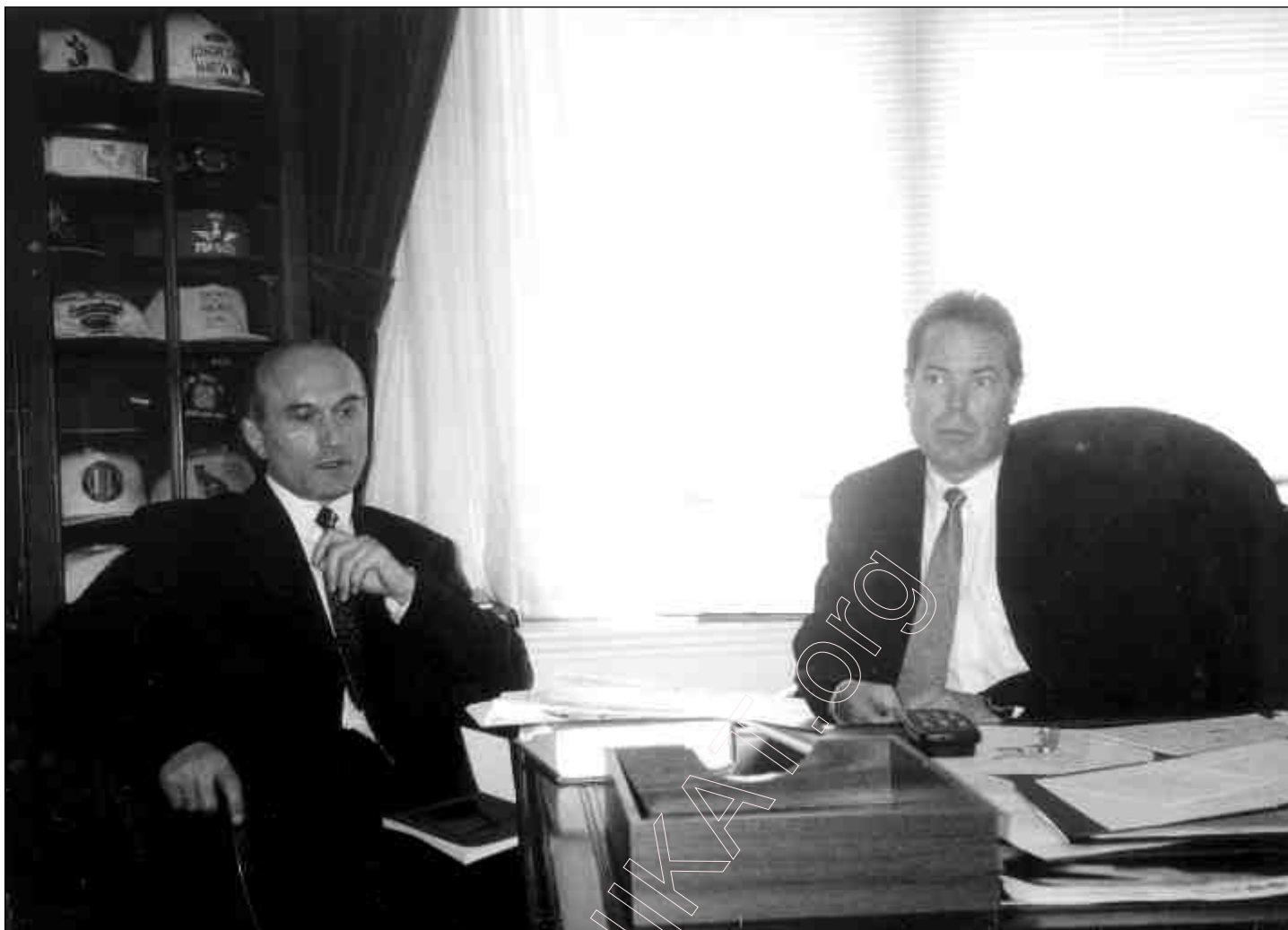
Вашынгтон. 1996 г. Развагі з кангрэсмэнам Марцінам Хокам.

нас (і, як я потым пераканаўся, у іншых краінах) брала на веру афіцыйную расейскую прапаганду і, не задумваючыся, тлумачыла паводзіны беларусаў якраз адсталасцю і масавым агульным грамадства.