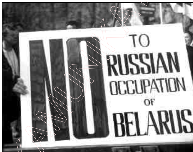
Лёўнг беларускага пратэсту.

(Komisja informacyjna Konserwatywno-Chrześcijańskiej Partii —BFN. W. Bujwał)