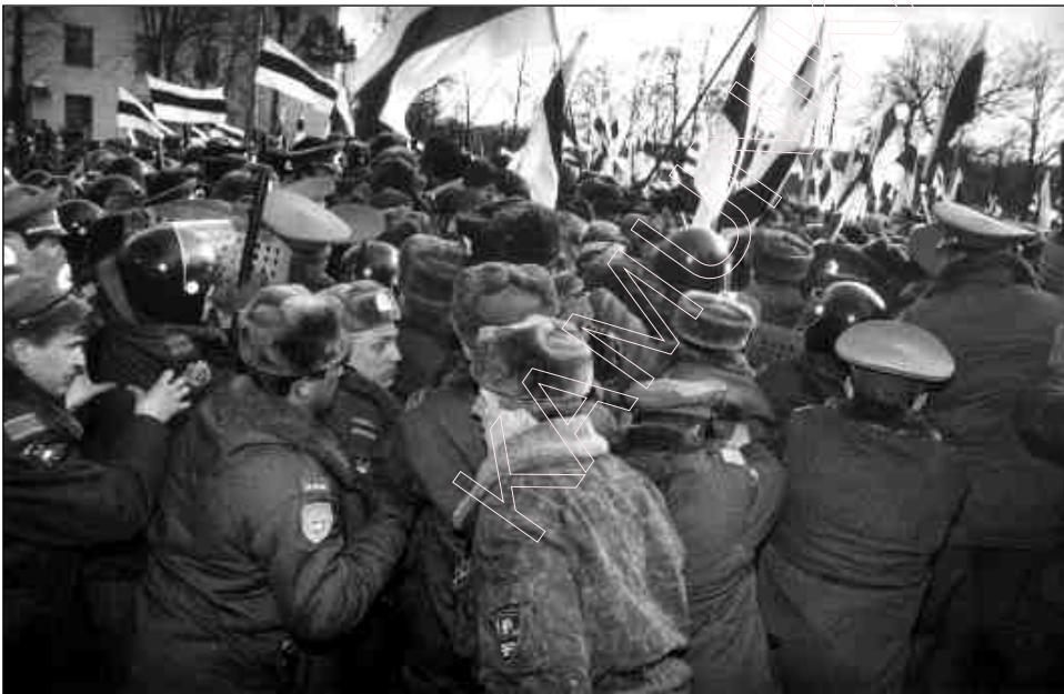
Менск. 24 сакавіка 1996 г. Міліцыя “трымае” падыход да будынку тэлебачаньня.

У сакавіку 1996 года было трывожна. Масква і рэжым Лукашэнка, ігнаруючы Канстытуцыю і заканадаўства, рыхтавалі падпісаньне ўмовы пра саюз Беларусі і Расеі. Мэта „саюзу” заключалася ў ліквідацыі незалежнасьці Беларусі і падпарадкаваньні яе Расейскай Фэдэрацыі. Беларускі Народны Фронт плянаваў вялікую маніфэстацыю пратэсту, прымеркаваную да Дня Незалежнасьці і 78-й гадавіны БНР .