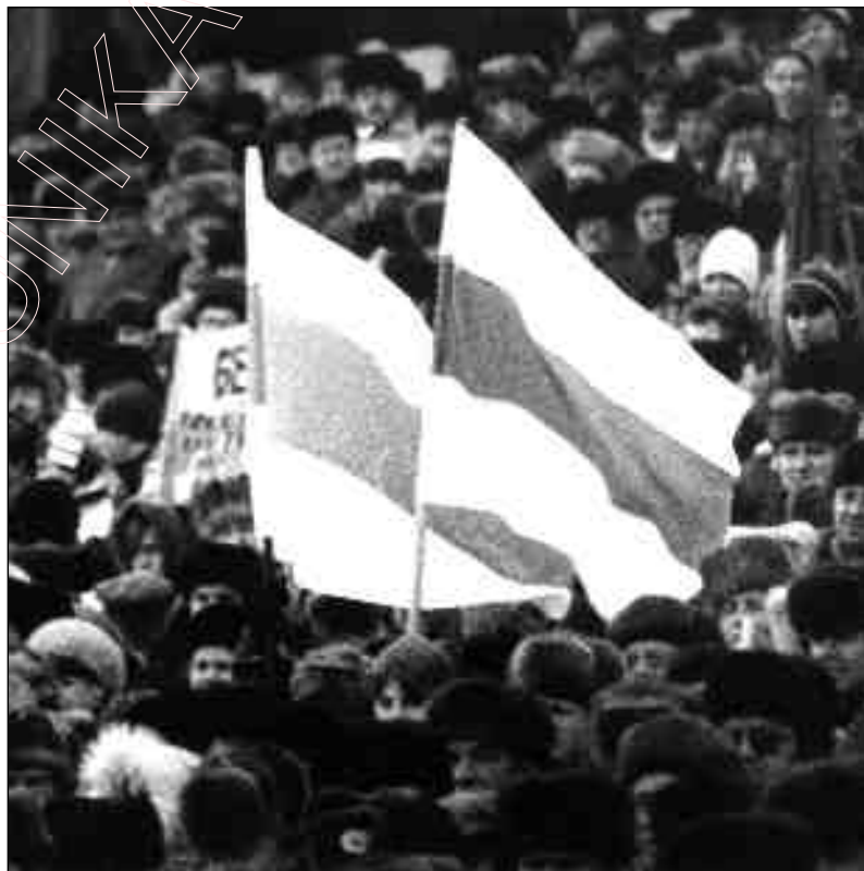
Беларускія сьцягі на фоне камуністычнай намэжкітуры. 1989 г., люты. Масавы мітынг БНФ на Менскім стадыёне “Дынама”; 40 тысячаў удзельнікаў.

Таму суддзя Эдуард Казлоў , блытаючыся, пасьпешна прысудзіў Андрэю штраф у памеры аднаго мінімальнага заробку (7,5 тысячаў рублёў