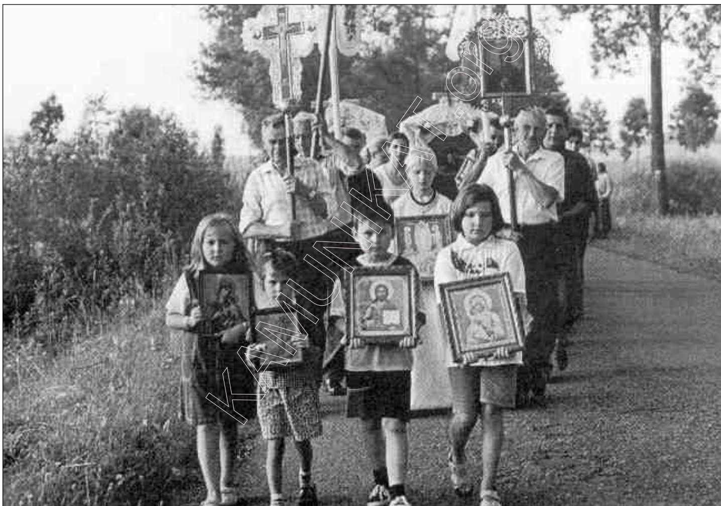
Идуць беларусы (Беласточчына)