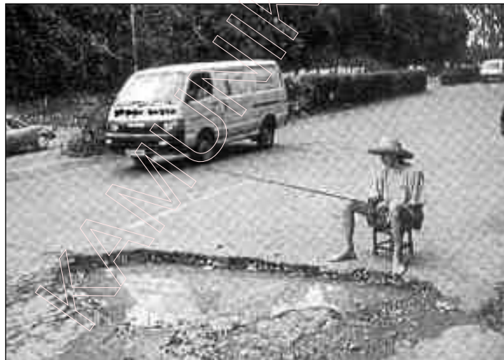
„Абы вайны не было.”

Representatives of the political parties were not included into the central and local electoral commissions. Many local commissions have had representatives of the same enterprise or institution as members. A representative of the state vertical has been included into every local commission. He or she directed and controlled the activity of the commission. On the pre-electoral stage collectors of signatures (members of the Conservative Christian Party — BPF) have been exposed to attacks and arrests by the state power. Mass media have been completely controlled by the regime and supported the unique candidate — Lukashenka. Editorial