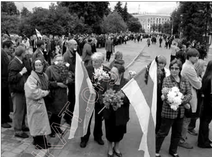
Развітаньне з Быкавым.

Шэрасьць прымітыўная. Стараючыся прынізіць лепшых, яна імкнецца ўзвысіць сябе і пачынае маніпуляваць імям вялікага (то „забываецца” ягонае прозьвішча, то перакручвае імя, то ня той націск, то ўдае няведаньне, як завуць і г.д.). Шэрасьць у гэты момант жыве ілюзіяй, быццам сьвет мераецца па ёй (маўляў, калі яна ня ведае, хто такі Арыстоцель, то які там яшчэ Арыстоцель). Шэрасьць