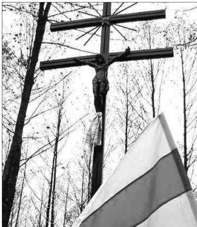
Крыж у памяць паўстанцаў 1863 года.

У гэты час у Пінск прыехалі швэды. Яны рабілі вечары паэзіі, на якіх павінны былі спаборнічаць маладыя паэты. Пераможца мусіў паехаць у Швэцыю. (Швэды, як і гнілая лібэральная дэмакратыя, лічаць, што падобнымі конкурсамі і „прызмамі” спрыяюць разьвіцьцю дэмакратыі і лепшаму жыцьцю