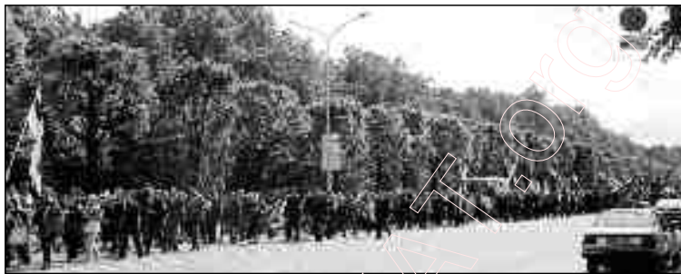
Працэсія. Пахаваньне Быкава.

■ Звычайна ў Менск не прыязджаюць прэзідэнты цывілізаваных краінаў. У Арменіі вельмі старажытная цывілізацыя, але цяперашняя халопская