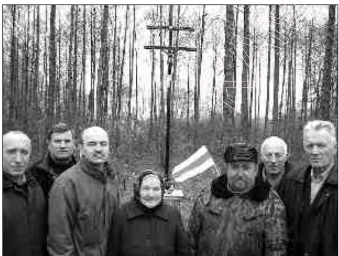
Ля крыжа .

25 Сакавіка, на Дзень Незалежнасьці, мы паставілі там трохмэтровы шасціканцовы дубовы крыж. Крыж асьвяціў айцец Генрых. Потым у вёсцы Асавая айцец Генрых рабіў літургію ў гонар Дня Незалежнасьці. Да гэтага часу гучаць у душы ягоныя словы із прапаведзі; „... ня толькі абвяшчэньне, але і стварэньне Беларускай Народнай Рэспублікі!”