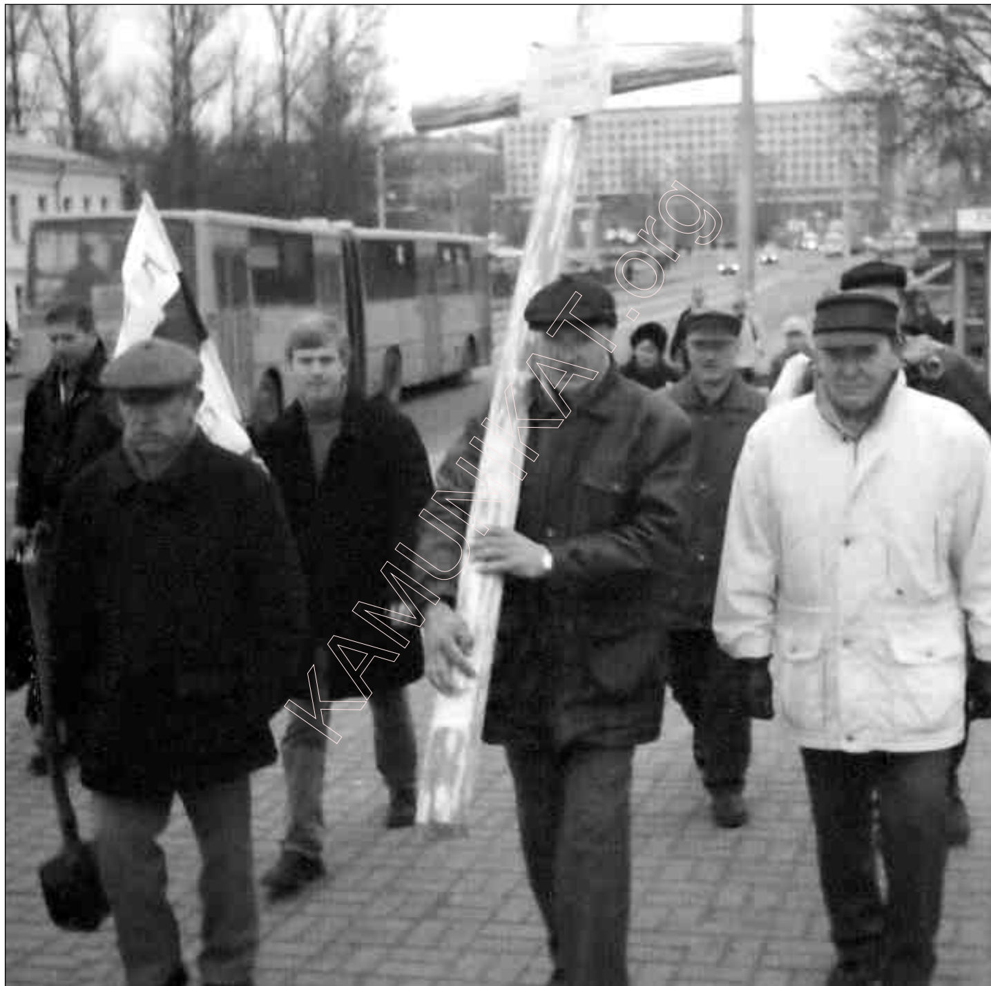
Сьвята Дзядоў у Віцебску. 2003 г.