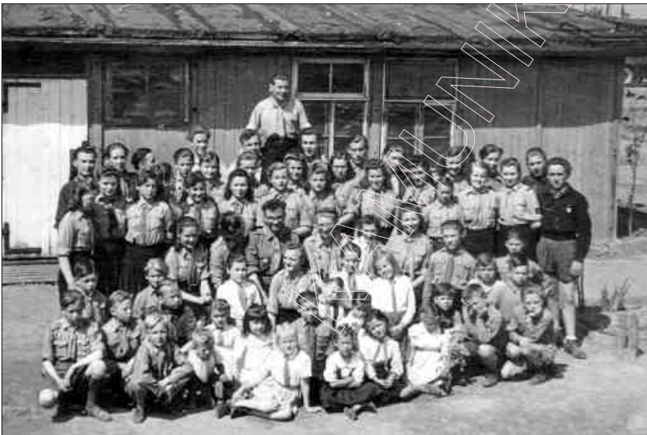
Беларускія скаўты ў лягерах Ватэнштэт. 1947 г.

Нас стараліся вучыць, як мага найлепш, як найбольш даць ведаў. Бо кожны разумее, што гэтыя абозы ня будуць вечныя, што гімназія ня будзе вечная, што