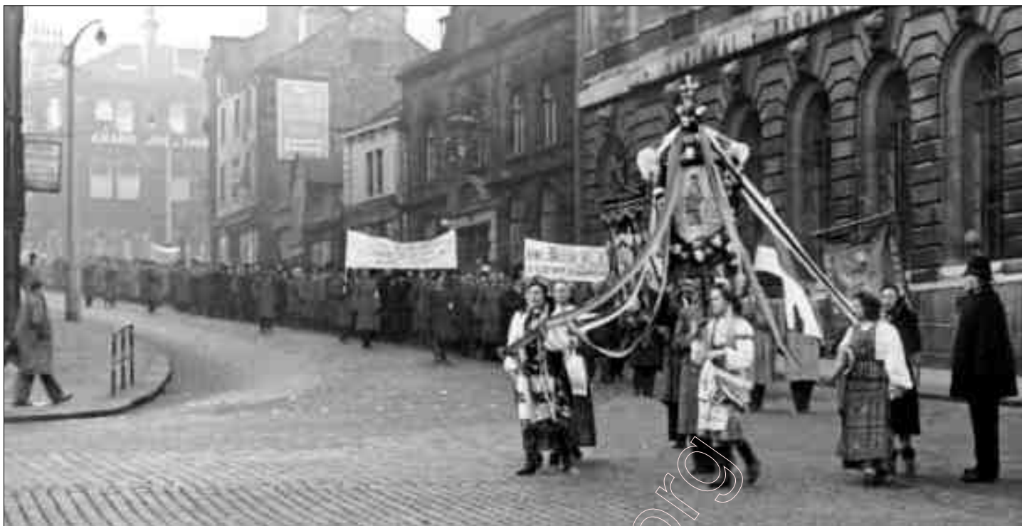
Першая беларуская дэманстрацыя ў Галіфаке на поўначы Англіі. 1949 г

адведваць. Так мы зьведвалі яшчэ больш беларусаў (а ў тых часы кожны беларус лічыўся, як свой родны). Як зарабілі першыя грошы, зараз з Кацяя паехалі ў Лёндан , каб спаткаць беларусаў і больш чаго даведацца, паглядзець, запазнацца. І так пачалося беларускае жыццё ў Англіі.