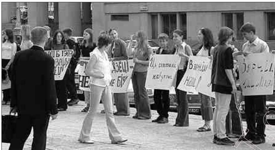
Ліцэйсты ў пікеце “Вярніце нашы ліцы!” Чэрвень 2003 г.

Паводле заяўнікаў, менавіта з-за абьявавага выканання службовых абавязкаў пералічаных асобаў падчас „піўнога” свята 30 траўня 1999 году на станцыі мэтро „Няміга” здарылася цісканіна, у якой загінулі 53 чалавекі.