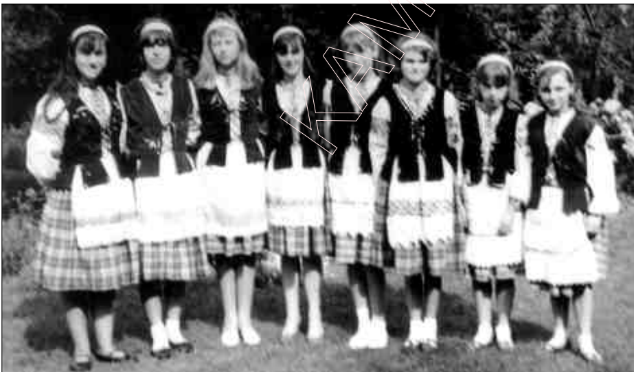
Беларускія дзяўчаткі ў Лёндане. 1967 г.

У 1953 годзе ў нас нарадзіўся першы сын, другі ў 1956-м, трэці — у 59-м. Як першы сын меў 8 гадоў, у Лёндане закладаўся беларускі інтэрнат для хлопцаў, якім кіравалі айцец А. Надсан і айцец Я. Гэрмановіч (гэта там, дзе цяперака бібліятэка знаходзіцца). Бібліятэка ўжо пасля была куплена, а спачатку былі закупленыя два дамы інтэрнату Беларускай каталіцкай місіі.