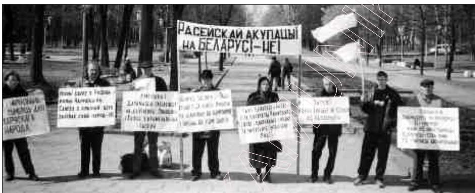
Народнафронтаўскі пікет у Віцебску (26 красавіка 2003 г.)