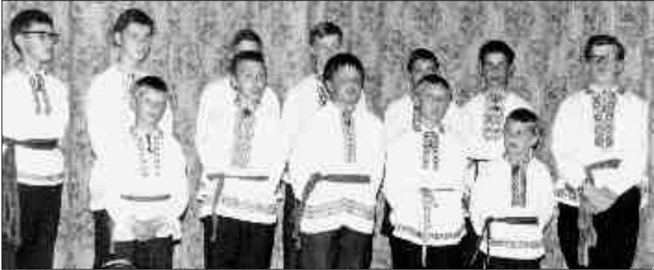
Беларускія школьнікі ў Беларускім інтэрнаце Сьв. Кірылы Тураўскага ў Лёндане. 1967 г.

Неўзабаве беларусы пачалі жаніцца, ужо дзеці пайшлі. У 1949 годзе ў Брадфордзе і я вышлі замуж за Янку Міхалюка і адразу купілі свой дом у Брадфордзе. У нашым доме жыло шмат беларусаў. У Англіі наогул было вельмі-вельмі шмат беларусаў, гурток наш там быў вельмі вялікі (ізноў жа, я кажу, пакуль не пачалі жаніцца і купляць свае дамы).