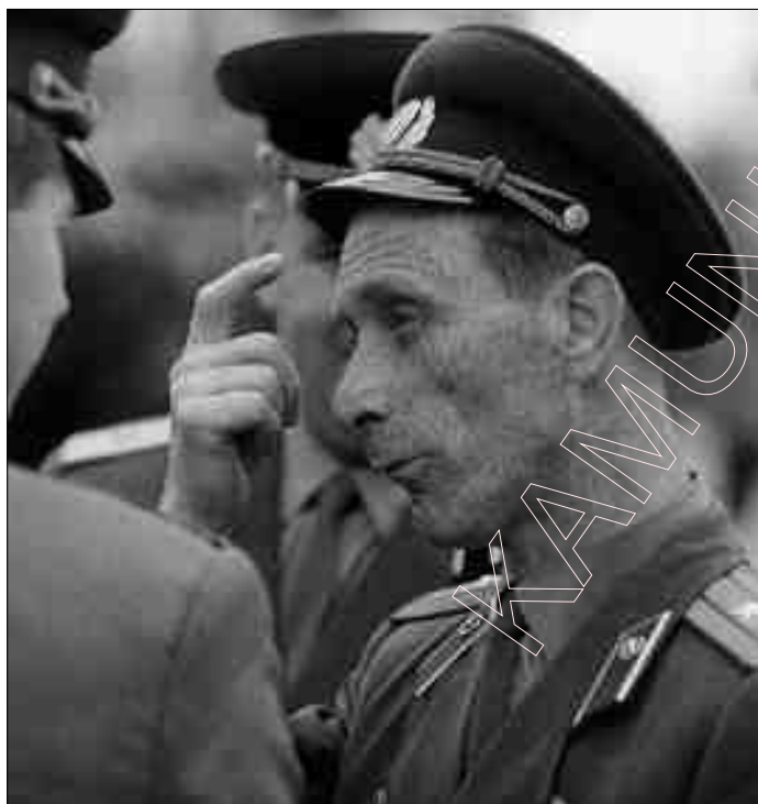
(Фота З. Ізваліка. 1964 г.)

Іванька вяртаўся. Як здоўжыўся шлях над гарамі. Дзе Вы, бацька мой любы І маці мая любая, Што на заводзе футаралаў Фарбуе тэлевізары... Як гайдаецца цынкавы мой самалёт Над Дзвіной, Як воблакі серабрацца... А вунь у садочку дзяўчына мая. А вунь на парозе матуля мая. А вунь каля брамы мой бацька стаіць... Не спаткай, не глядзі на мяне да сьвітаньня. Не кладзі мне чырвоныя кветы. Лепш хай прыме труну той маскаль-ваенком.