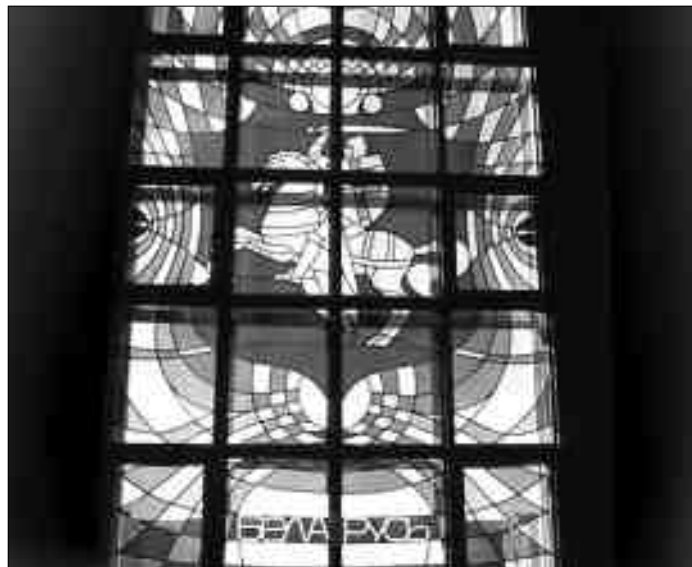
Беларусь за кратамі (Віцебск).

Спэцыфічным у гэтай цяперашняй імпэрскай палітыцы зьяўляецца тое, што ажыццяўляецца яна пры канкрэтным удзеле і дапамозе немцаў, якія ўключыліся ў яе ў канцы 1996 г. і ўзялі на сябе ў асноўным трэці накірунак нішчэньня Беларусі (г. зн. стварэньне кампрадорскай ненацыянальнай палітычнай эліты). Сумесныя дзеянні рэжыму, гансвікаў, цапфаў, фрыкаў і КГБ-ФСБ мелі нядобрая вынікі – быў стлумлены нацыянальны грамадзкі