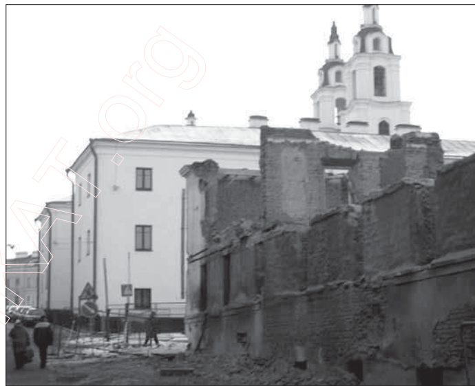
7. 2007 г. Разбурэньне старога Менска. Вуліца Бернардынская (Бакуніна). Справа руіны разбуранага антыбеларускімі ўладамі будынка 18-га стагодзьзя.

„У 2004 г., у Беларускага добраахвотнага таварыства аховы помнікаў гісторыі і культуры незаконна нацыяналізавалі на карысьць дзяржавы будынак, які быў адроджаны ў Траецкім прадмесьці за сродкі арганізацыі, як практычна і ўсе будынкi гэтага гістарычнага кварталу. У ў дзяржавы хапіла сумленьня зрабіць былога інвестара арандатарам, а зараз, у выкананні чарговага прэзідэнтскага ўказу па эканамічнаму знішчэньні грамадзянскай супольнасьці, з Таварыствам не працягнута дамова арэнды, і арганізацыі прапанавана 15.05.2008 г. да 15.00 пакінуць свае памяшканні.