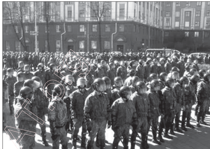
5. Дзень Незалежнасьці. Менск. 25 – за Сакавіка 2007 г.

Пазыняк сказаў (упершыню), што забівалі вось тут, побач, дзе ты ці твой знаёмы у мінулую суботу з кампаніяй смажылі шашлык. Пазыняк цытаваў расповеды жыхароў навакольных вёсак, і нешта жахлівае было ў тым спалучэньні будзёнасьці і трагедыі, якая ажывала ў словах сьведкаў. Пазыняк даказаў, што зьнішчалі ня толькі вышэйшую наменклатуру, ня толькі інтэлектуальную эліту (хаця, канешне, вынішчаць імкнуліся найперш эліту, ды і нацыянальна арыентаванае кіраўніцтва таксама), – забівалі тысячы простых сялян, тысячы звычайных рабочых.