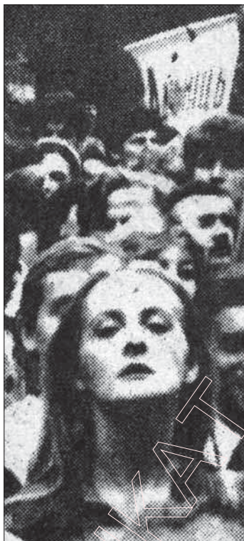
9. 1988 г. На першым мэмарыяльным мітынгу ў Курапатах.