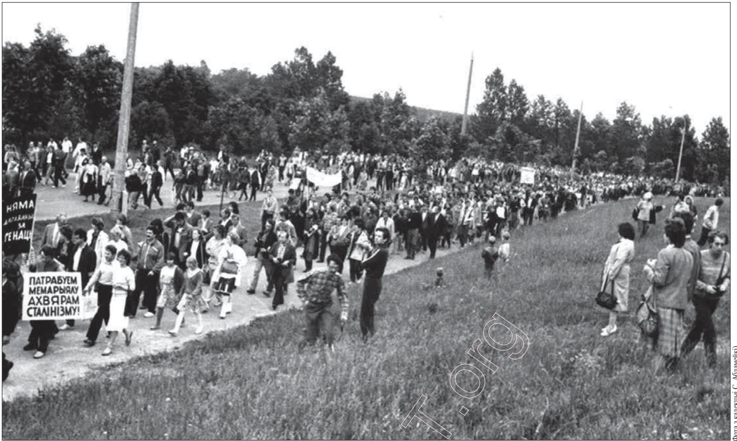
б. Менск, 19 – га чэрвеня 1988 г. Людзі йдуць на мітынг ў Курапаты.