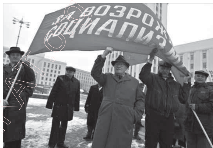
8. 2007 г. „За возрождение социализма”. Дэманстрацыя камуністаў на плошчы Незалежнасці ў Менску.

Заўважым, што калі гаворка ідзе пра адносна надзейна працуючыя АЭС (не расейскай вытворчасці), без частых аварыйных выкідаў, дык таксама існуюць даказаныя факты адмоўнага ўздзеяння АЭС на чалавека. Так у штаце Маса-чусэтс, было выяўлена, што ў людзей, якія працуюць і жывуць у дваццацімілевай зоне АЭС „Пілігрым”, каля Плімута, у чатыры разы вышэй захворванне лейкеміяй, чым звычайна. Павялічаная колькасць выпадкаў рака у зоне АЭС „Траян”, штат Арэгон. У паселішчы, каля брытанскага ядзернага цэнтра ў Селафілдзе, захворванне дзяцей лейкеміяй у 10 разоў вышэй чым па краіне.