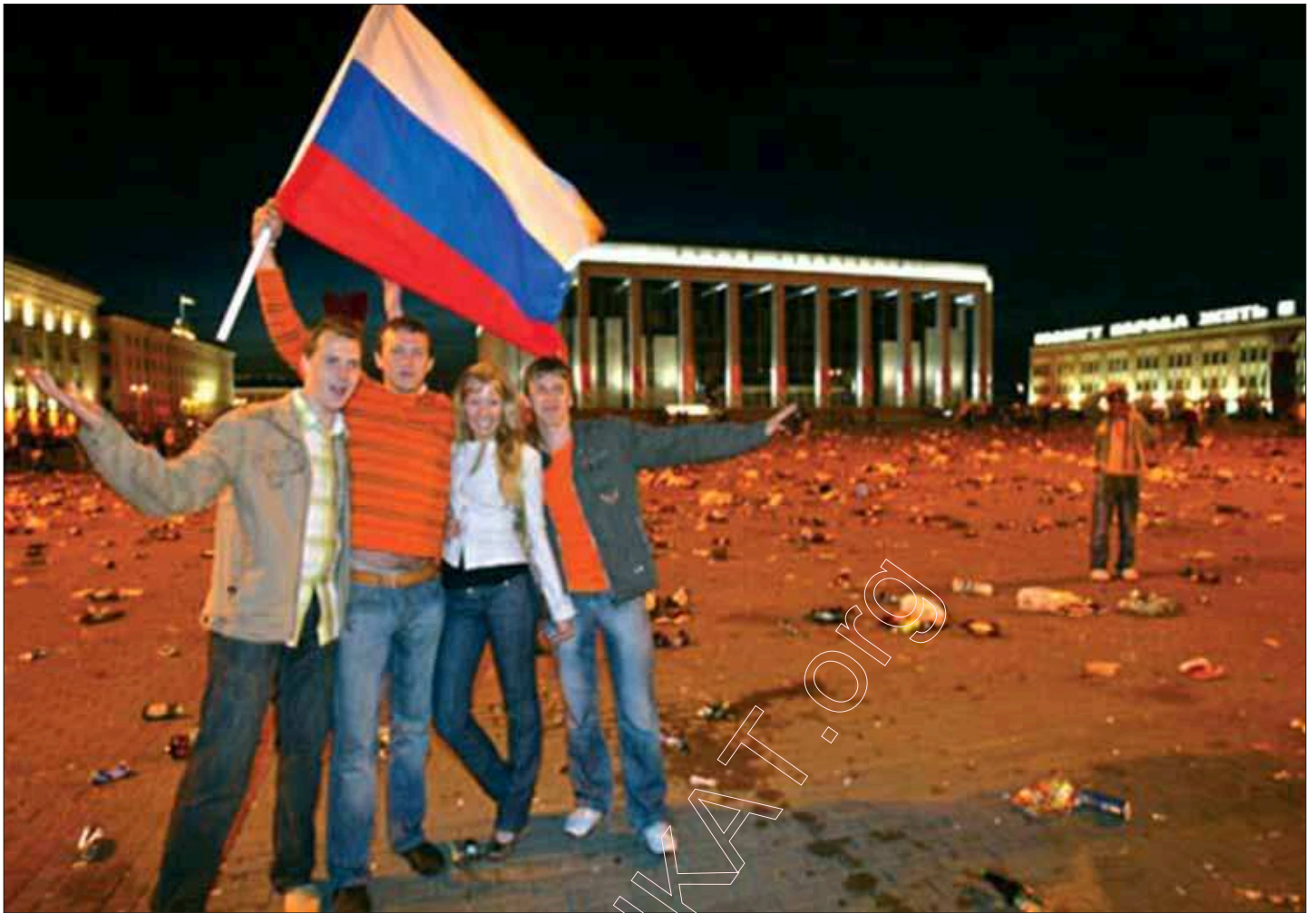
2. Паралельны сьвет альбо «русские прошли». Вось што пакінулі пасля сябе некалькі сотняў расейскіх (ці няхай сабе – „прарасейскіх”) аматараў футбола, што глядзелі матч „Расія – Іспанія” ля тэлеэкрана на Цэнтральнай плошчы Менска. Такога ў Менску не было за ўсю дакумэнтаваную гісторыю горада. Гэты здымак фотажурналісткі Юліі Дарашкевіч ( http://www.nn.by/index.php?c=ar&i=18037 ) успрымаецца як сымвал брыдоты і ўсяго таго што навалілася і адбываецца цяпер у Беларусі.