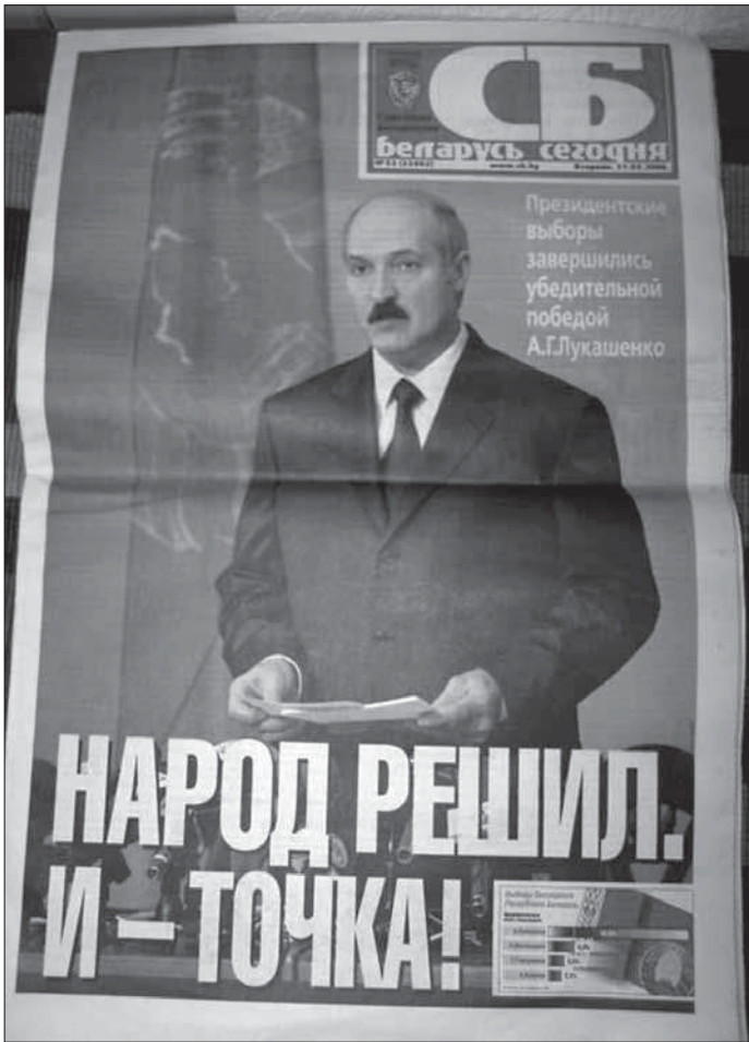
4. Трэці тэрмін: „Президентские выборы завершились убедительной победой Лукашенко” («Советская Белоруссия»).

доказы, угаворы, лісты, ськіраваныя да гэтае публікі, ня маюць сэнсу. (Мы ўсё гэта перажылі.)