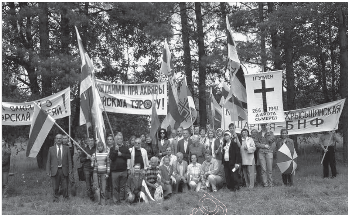
Група сяброў Кансэрватыўна–Хрысьціянскай Партыі БНФ на месцы расстрэлу людзей каля Ігумена. Ліпень 2008 г.

29 чэрвеня Кансэрватыўна–Хрысьціянская Партыя – БНФ арганізавала штогадовыя мэмарыяльныя мерапрыемствы паблізу г. Чэрвеня (былы Ігумен) Менскага раёну. Да сяброў Партыі далучылася шмат дзяўчат і хлопцаў – маладых беларускіх патрыётаў. Прыбыла дэлегацыя летувіскай моладзі пад нацыянальна–дзяржаўным сьцягам Летувы. Удзельнікі пачалі Шлях ад будынка былой Ігуменскай турмы. Гэты астрог расейскія акупанты нашай зямлі пабудавалі яшчэ на прыканцы 18 стагоддзя. Яны пакарысталіся астрагам і ў чэрвені 1941 года, калі каты НКВД гналі калёны вязьняў зь Менскай ды Вялейскай турмаў ў бок Расеі. Вязьняў вывелі з Ігуменскай турмы 25 чэрвеня і пагналі па дарозе. У лясным масіве Цагельня акупанты адкры-