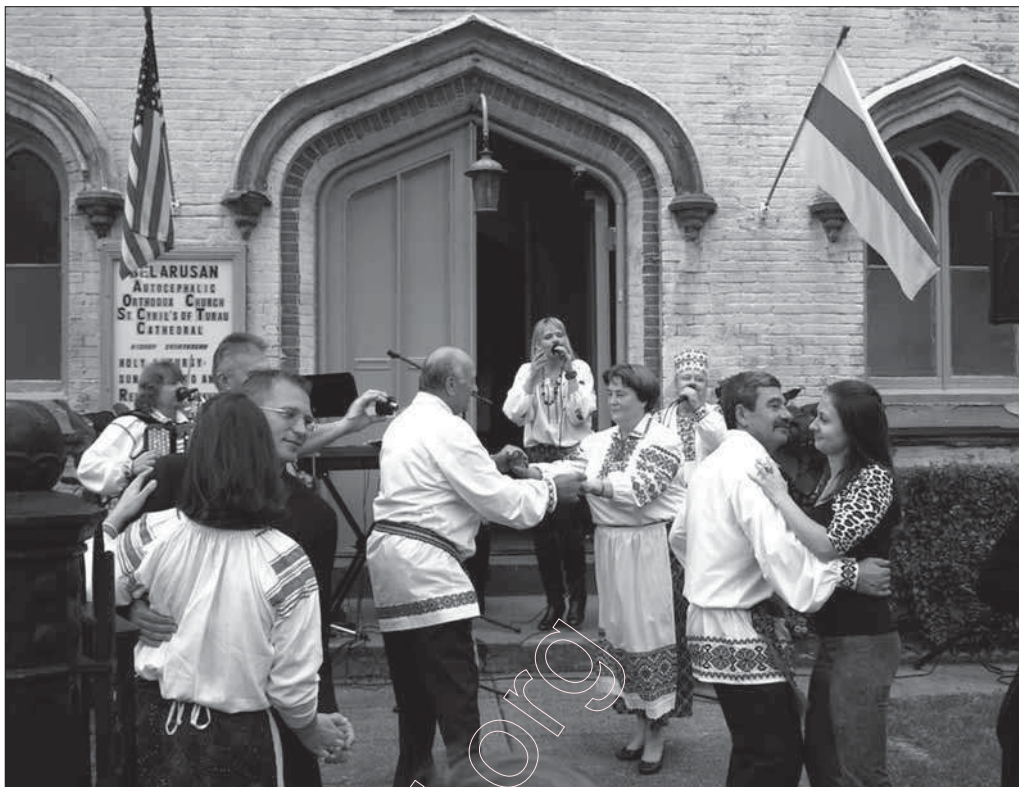
Фэстываль у Брукліне. Каля Сабору сьв. Кірылы Тураўскага.

У Расіі створаная ўрадавая структура, так званая „Федэральнае агенцтва па справах СНД”, якое плянуюць легальна скарыстаць у Беларусі для падтрымкі русіфікацыі, стварэння расейскай рэзыдэнтуры і рускай пятай калёны.