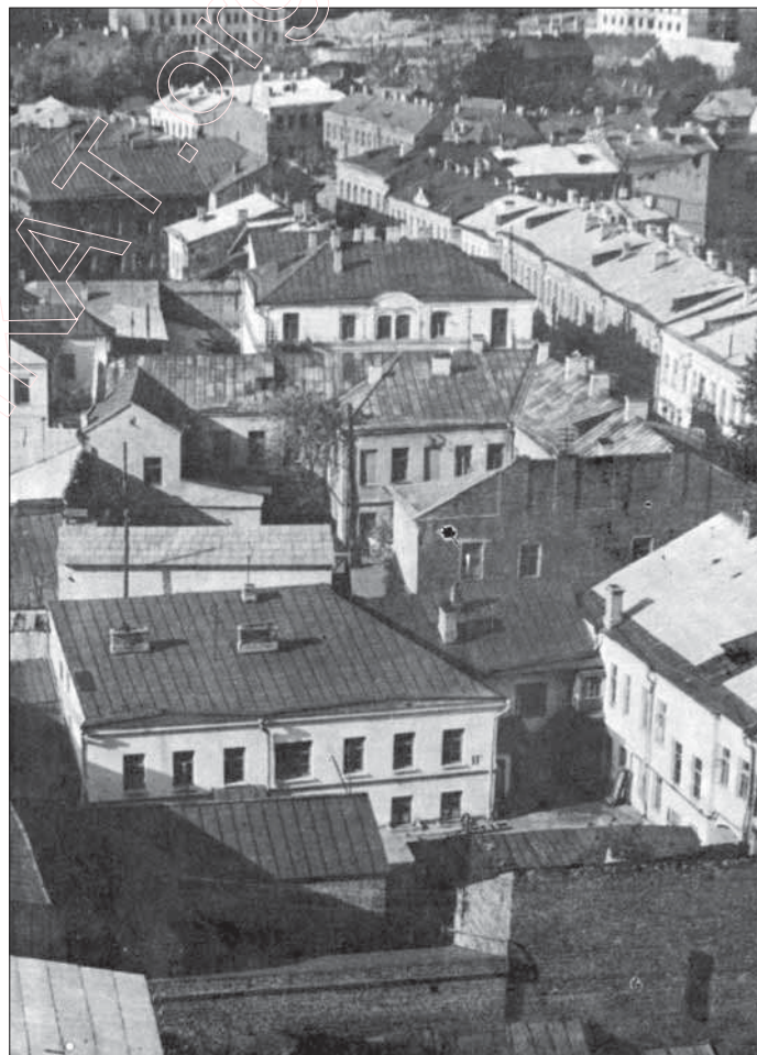
Забудова вуліцы Нямізі (XVIII–XIX ст.ст.) ў Менску; разбураная саветамі на ініцыятыве Першага сакратара ЦК КПБ П. Маішэрава ў 1972–74 гг.