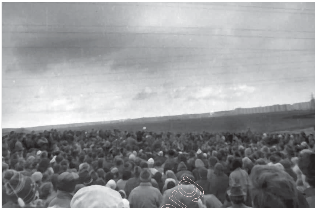
30 кастрычніка 1988 года. Мітынг у полі.

Вырасла ўжо цэлае пакаленьне нашага народу, для якога існуе толькі цяперашняе status quo: незалежная Беларуская Дзяржава. У 1988–91 гадах адбыліся такія вялікія падзеі, што дагэтуль усе намаганьні русіфікатараў, акупантаў і іхных паслугачоў ня могуць зьмяніць гэтага прызнанага сьветам факту. Без перабольшваньня можна сказаць, што для нашых маладых народнае рушаньне тых гадоў зьяўляецца такой жа хрэстаматыйнай клясікай, як штурм Бастыліі для французкай моладзі, аб’яднаньне Нямецчыны Бісмаркам для нямецкай або рэвалюцыя „Салідарнасьці” для польскіх маладых. Гэта ўжо гісторыя, гэта – пласт, які стаў асновай, грунтам для сёньняшняга разьвіцьця нацыі і краіны. Мы, – непасрэдня ўдзельнікі тых падзеяў, – яшчэ не да канца ўсьведамляем гэты гістарызм.