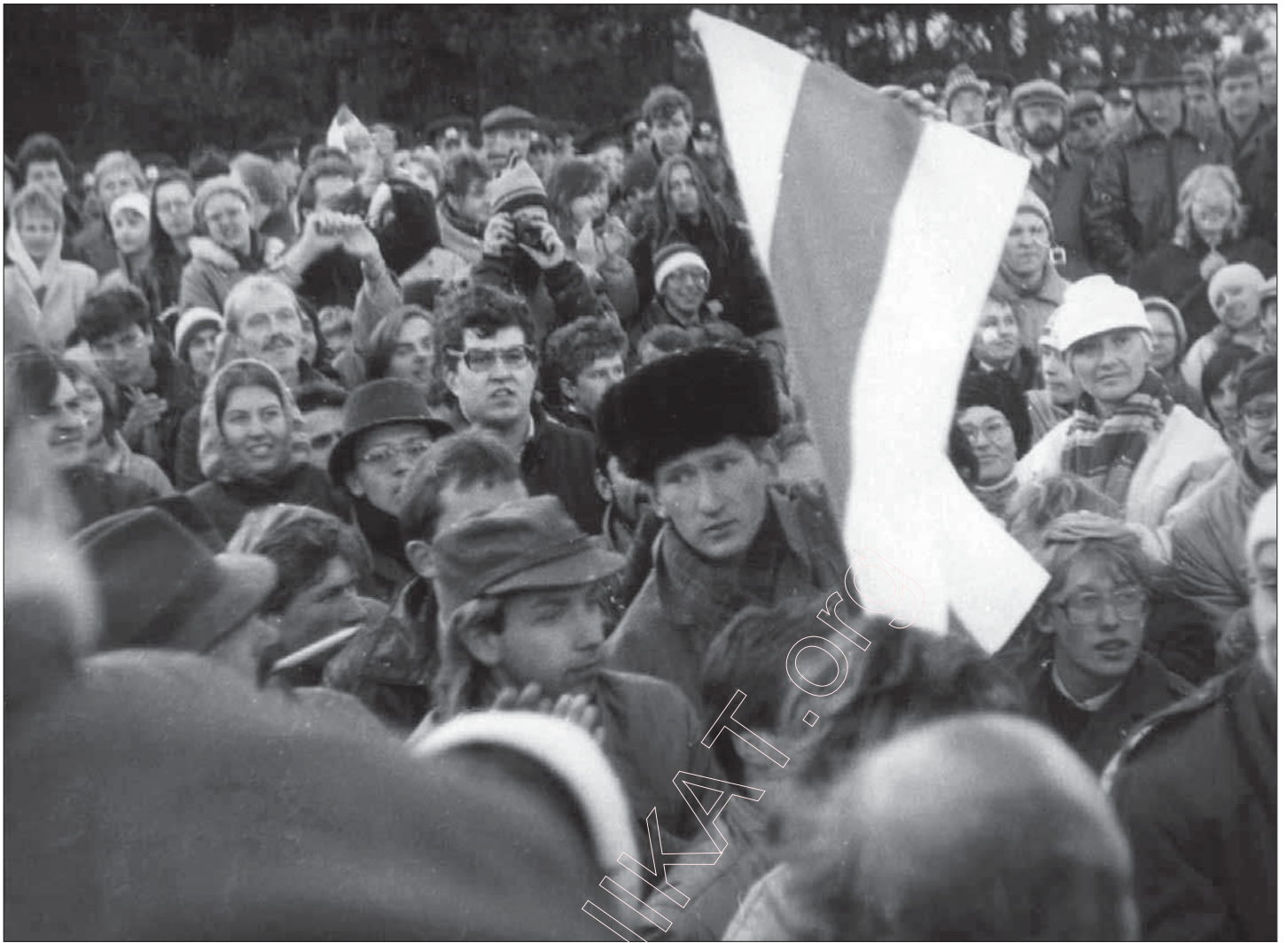
30 кастрычніка 1988 года. Мітынг у полі. Першае падняццё Бел-Чырвона-Белага Сьцяга.

Вярнуўшыся на Беларусь, я, аднак, даведаўся пра публікацыю артыкула Зянона Пазьняка і Яўгена Шмыгалёва „Шумяць над магіламі сосны” у газэце „Літаратура і мастацтва”. Усе абмяркоўвалі гэты артыкул і першы мітынг, які адбыўся ў Курапатах у чэрвені. З Прыбалтыкі даходзілі звесткі пра стварэньне Народных Фронтаў і шматтысячныя выступы патрыётаў. 19 кастрычніка 1988 г. я ня здолеў прысутнічаць на ўстаноўчым сходзе ў Чырвоным касьцёле ў Менску, на якім быў утвораны Аргкамітэт Беларускага Народнага Фронта „Адраджэньне”. Мусіў працаваць з калегамі над падрыхтоўкай выставы сучаснага жывапісу, якая прыехала ў наш Музей з Канады. Але звестка была ва ўсіх на вуснах: „Утварыўся Народны Фронт, правалілася спроба намэнклятуры запалохаць людзей...”